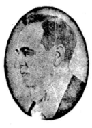
大統領の所見を發表した問題に關する所見を發表した。

大統領は、米の善隣政策に順應し、時局問題に關し所見を波歴する。伯國は中立を堅持する。