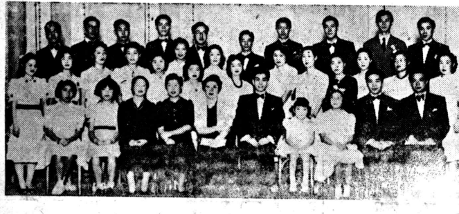
【リオ十三日日本電】合唱団のメンバーたち