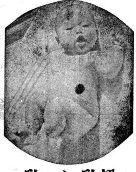
乳煉と乳粉 注意へ見養工入