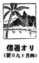
信通オリ (設日九十月四)