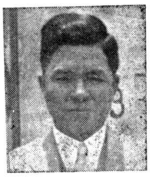
亞細亞航空路歸伯...