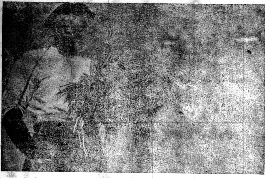
小島にかけた大船... (Caption for the portrait)