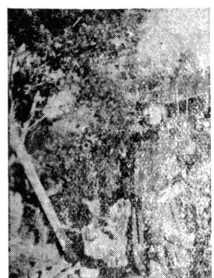
【寫眞説明】中支に樹てられた美觀となつた忠勇なる荒鷲や...

Noticias de S. Paulo Primeiro Diario Nipponico Publicado no Brasil DARIO P. ALMEIDA DIRECTOR ROURO KOWYAMA PROPRIETARIO Caixa Postal, 2765 Telephone 2-5655 Rua Assembla No. 54 SAO PAULO-BRASIL ASSIGNATURAS Ano - - - - - 60$000 Semestre - - - 30$000 Numero do dia - $500 Exterior, anno - 120$000