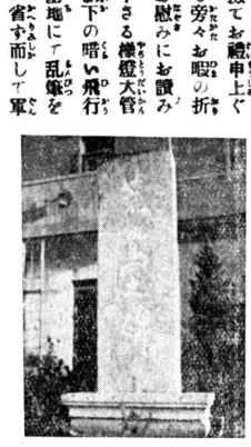
【寫眞説明】中支に樹てられた美觀となつた忠勇なる荒鷲や...