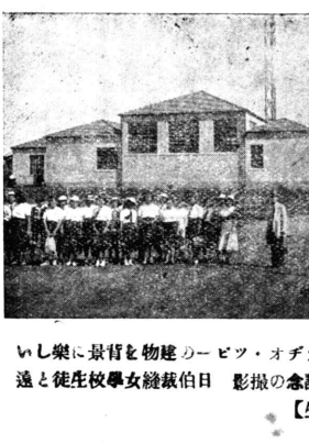
ツツビーを參觀して、日伯裁縫女学校の遠足記。ツツビーを參觀して、日伯裁縫女学校の遠足記。