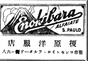
店服洋原 八六一番ドールフ・ロイレンコ市聖