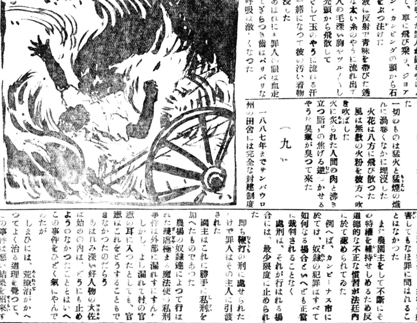
富岡村 安藤全八 作