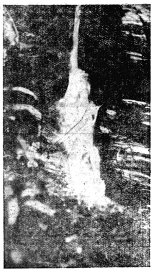
【見よ涼しい飛瀑、到る處に存在】

世界に誇る南米の首府リオ・デ・ジャネイロより僅か、四十基米突の地點。聯邦政府が全力を注ぎ、既に好成績を治めつゝある、サンタ・クルース植民地の隣接地