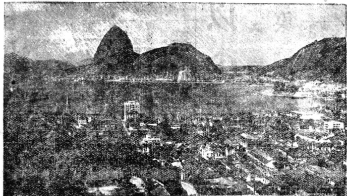
【無慮三百万人になんなんとする首府リオデ】