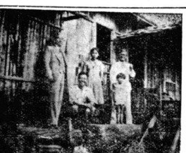
着のみ着の儘 涙ぐましい隣人愛