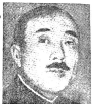
記者 陸軍省の軍事行動が...