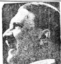
伯林、羅馬樞軸の強化...