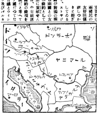
二一歐東中目耳の界世