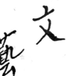
グワラニの旅断片(2)