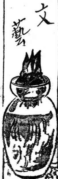
グワラニの旅断片(2)