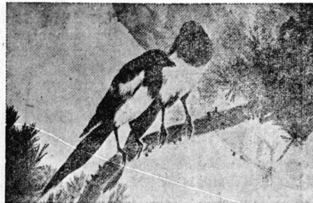
【明説眞寫】館長ハル米の買上げに...