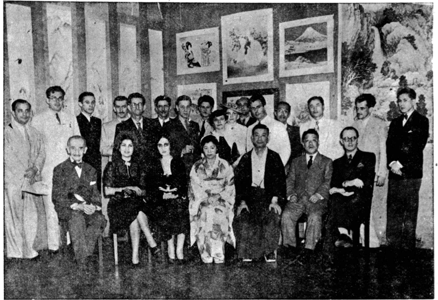
の参見氏次又中福の領主會協術美に並會協術藝ルグラの参見氏次又中福の領主會協術美に並會協術藝ルグラ...