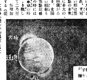
太陽の黒點の増大。地球の温度も上昇する可能性がある。

太陽の黒點は、太陽の表面に現はれる暗い斑点である。これは、太陽の表面温度が周囲より低い部分である。黒點の増大は、太陽の活動が活発であることを示している。黒點の増大は、地球の温度を上昇させる可能性がある。黒點の増大は、地球の気候に影響を及ぼす可能性がある。黒點の増大は、地球の生態系に影響を及ぼす可能性がある。黒點の増大は、地球の歴史の中で繰り返されてきた現象である。黒點の増大は、地球の未来に影響を及ぼす可能性がある。