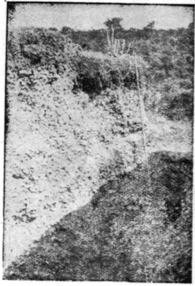
古貝塚の断面を示す