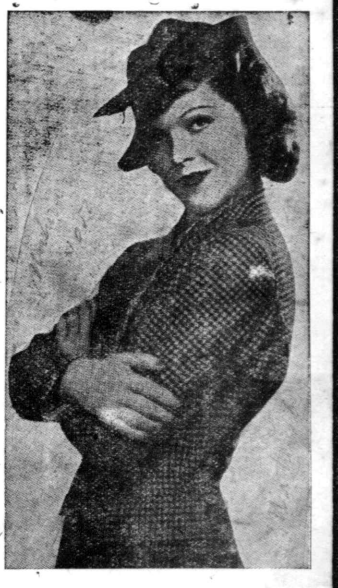
到る所有名藥店に販賣す