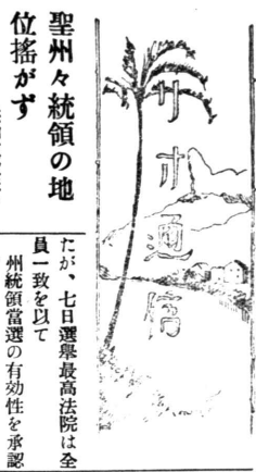
聖州々統領の地 位格が...