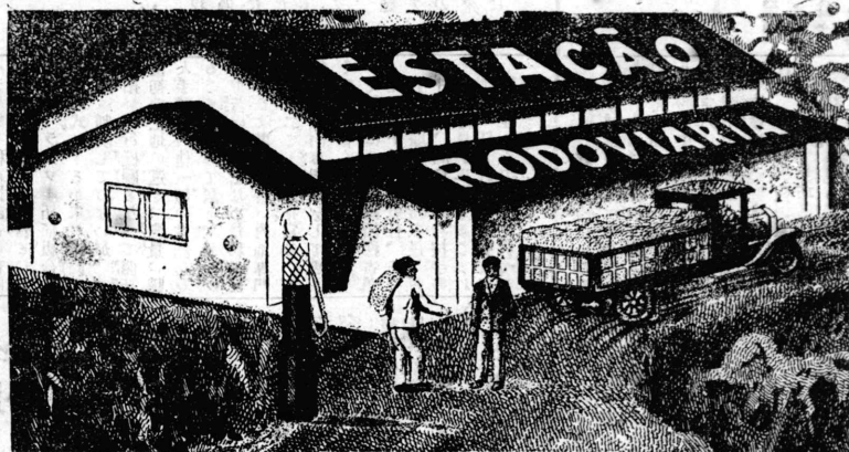
(ロキ十四長延のを通賃を地民植は道車回、景一の地民植當近附道車州)

庫寶の一唯たれさ残に州口ウパンサ 復往スパ期定りよ場廣スロイネピ日毎……便至通交間市聖てし而……地作農の適好……備完道車