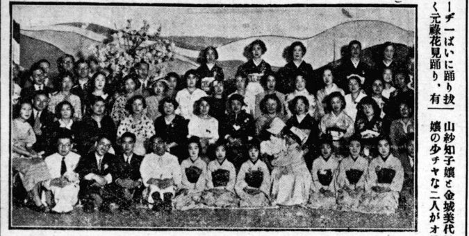
シヤシンテンツ慈善演藝會のメンバーたち。