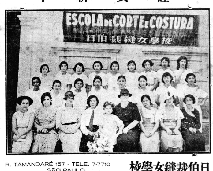
ESCOLA DE CORTE E COSTURA 日伯裁縫女學校 R. TAMANDARÉ 157 - TELE. 7-7710 SÃO PAULO