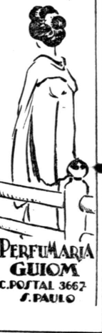
PERFUMARIA GIOM C. POSTAL 3662 S. PAULO