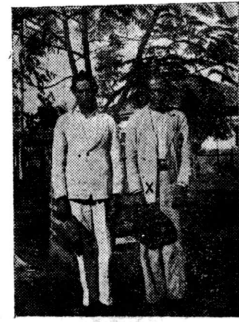
【明説眞實】 フルンドリの答にこれ殺が印X