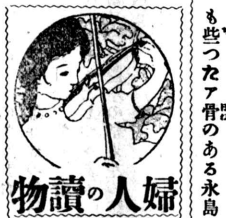
婦人の読物 愛子のしつけ方 死を恐れる 空想を去る

「何れに居るんだい?」 「此の雪乃さん、此方の縁に...」 「此方の縁に?」 「此方の縁に?」