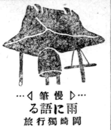
雨に待てる旅 筆語 獨行