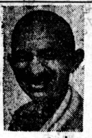
如何にガンジーは 印度の獨立をさげふか