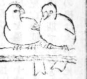
者ね 勘 市周阿耶

日本に居た時から二年三年、永くつて五年と云ふやうに轉々として所を替へて来た、自分の家と名のつゝも持たぬ私は同じ土地で五六度も轉宅をした一度思ひ立てば矢も楯もなく引越した、定住性が欠けて居るのかも知れぬ。私は家を替へ土地を移ることによつて自分の氣を引き立て新運命を辿らうとした、私は古いものから新しいものへと時を追つて流れて来た。然しそれは皆駄目なものであつた、濁るゝものゝもがに過ぎなかつた、運命といふ強いつゝに私をそのもがから逃して呉れなかつた。 世の中には平坦のやうな境遇を追つて行く人がある。すらすらと順風に乗つて行く人もある。然し私の辿るレールは何処まで行つても行つても釘づつられた何かの強いものと並行してゐるやうだ。古い傷痕を一つづつ、新しい傷痕を一つづつ負つて私に運命と云ふ家を背負つて轉々として歩いた。残るのは傷ましい焦燥と喘ぎである。傷つて果敢なみ、探まれては恨みつゝ、それでも温かい人の觸れ合を慕つて寂しい自分一人の狭い世界を歩いて来た。 私は獨善主義者である、私はエゴイストである。そのエゴイズムも私にとつては一つの逃避路であつた、自分の生命を生かすための手段であつた、自分自身を欺き、逃口上を求めて自分を弁解しつゝ生きて来た。私は勘ね者と葬り去らるゝことを極度に恐れて来た、にもかかはらず私の周囲は一年毎に狭められた、あることを自覺せねばならなかつた、いぢけをいために戦ひ自分を強く生かすために闘争して来たが、愛し得ざるもののみが味はねばならぬ哀愁と寂寞を重ぬる毎に私は情けと誠を素直