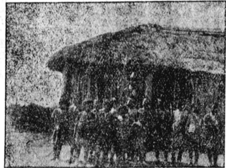
芝居及校學小デラグラバの前築改 (生先岡丸が中央)