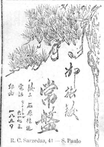
R. C. Sarzedas, 41 - S. Paulo