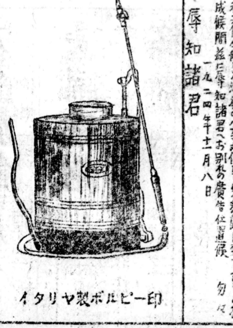
イタリヤ製ボルビー印