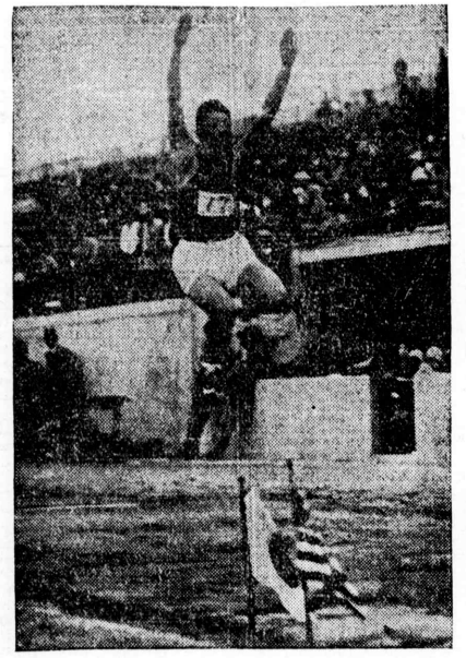
Chuhel Nanbu (Top) is seen in action during the recent Olympic trials in Japan at the Meiji shrine grounds. Note the two flags in the foreground. The Hino-maru flag denotes the all-Japan record while the other emblem marks the distance for the world's record.

Nanbu holds the unofficial world's record with a leap of 26 feet 1-2 inches while Silvio Castor (Lower) holds the recognized world's broad jump title with a mark of 26 feet 1-8 inch which he set at Paris in 1928.