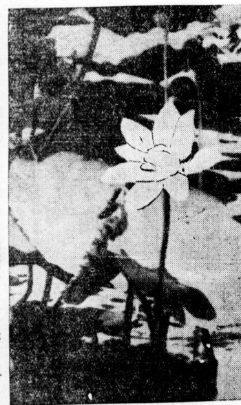
白雲にまじりて寄せてはみる見のよみかみ離座の花