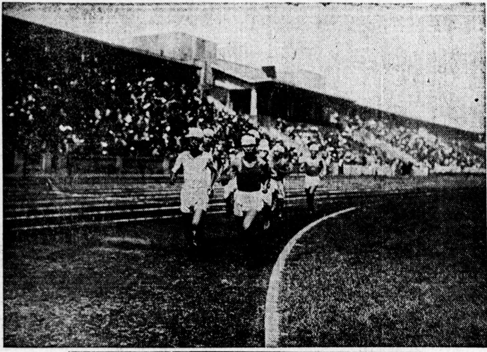
會大選豫クツピムリオ本日全

りよ時十前午日九廿の日終選會大補手選豫クツピムリオ... ーメスの走競ソラマ子男は真實 たれは行舉てにクツラト宛外宮神