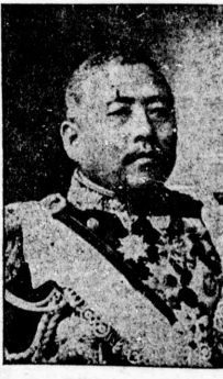
内閣総理大臣 齋藤 實 兼 外務大臣

何れも天下の人材揃ひ 建以ての難局に直面し幾多の迂回曲折を経て漸く成立し 齋藤内閣の顔ぶれ及其略歴は左の通りである