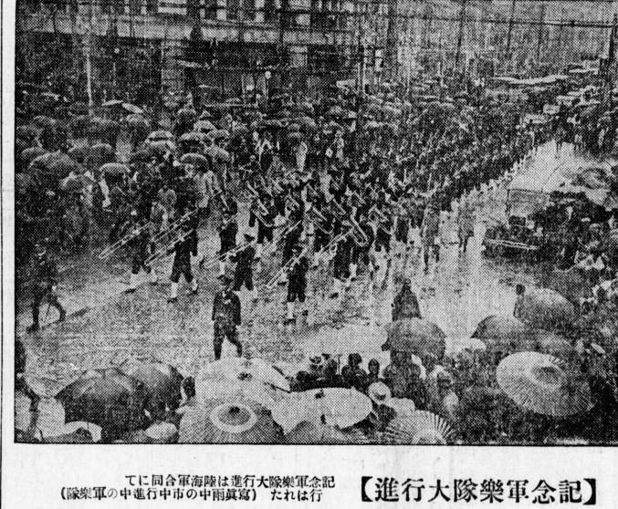
【進行大隊樂軍念記】

反吉林軍 特別議會 (東京十四日電) 反吉林軍の特別議會が開かれた。反吉林軍の特別議會が開かれた。反吉林軍の特別議會が開かれた。