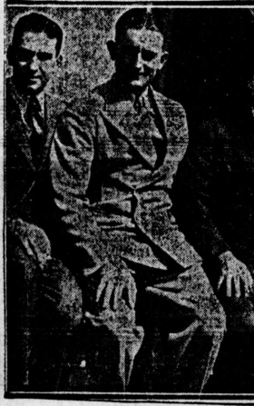
渡りし米日先次途の橋に戦さるけにバーニキ...