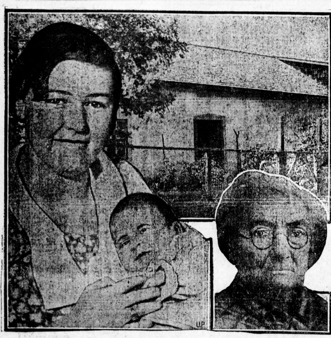
三代の生家... 三代の生家... 三代の生家...

一八七七年に、この樹の種子がアフリカに運ばれた。これは、一八七七年に、この樹の種子がアフリカに運ばれた。これは、一八七七年に、この樹の種子がアフリカに運ばれた。