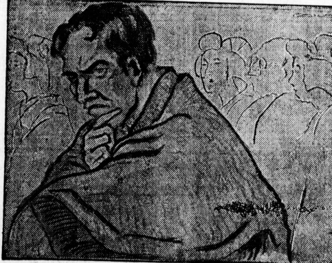
桑港市場 野果物標準値段 三月廿三日