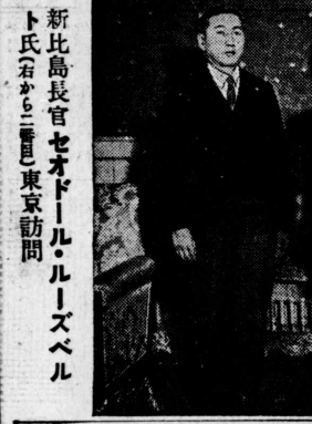
新比島長官セオールド・ルーズベルト氏らから三浦東京訪問