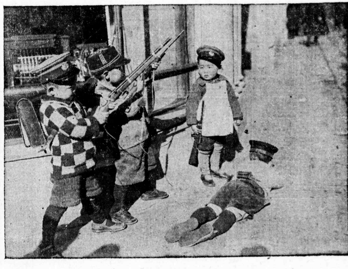
今日本少の戦争争つこ