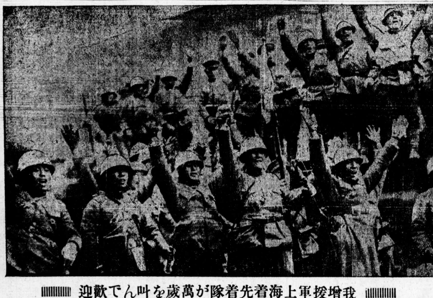
迎歡でん叫を歳萬が隊着先着海上軍援増我