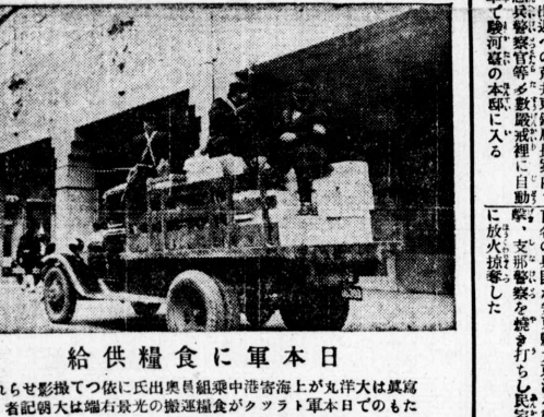
給供糧食に軍本日

(東京五日電) 兵匪襲撃、安東縣大東を。これは、安東縣大東の襲撃に関するニュースである。