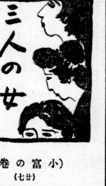
三人の女 (卷の富小) (七廿)

（上海廿六日電）日本軍は、進撃が困難な状況にあると報告された。また、日本軍は、進撃が困難な状況にあると報告された。また、日本軍は、進撃が困難な状況にあると報告された。