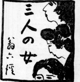
三人の女 (卷の富小) (三廿)