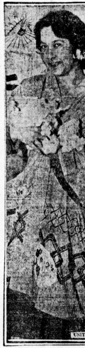
グレイダガボの女優写真

「女軍探偵」 グレイダガボ出演。女軍探偵。グレイダガボ出演。女軍探偵。グレイダガボ出演。女軍探偵。