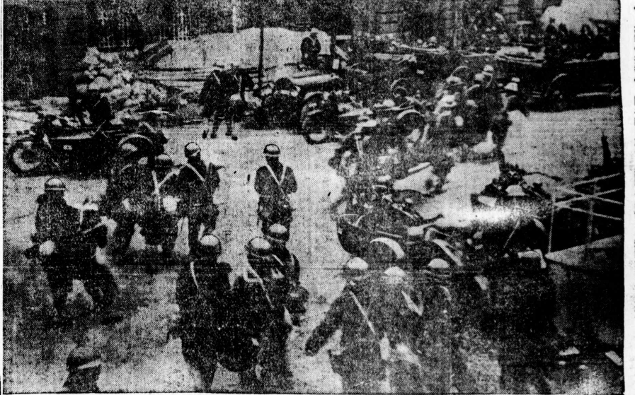
上海戦事... 開戦に於ける激戦地を病院に運ぶ日本軍