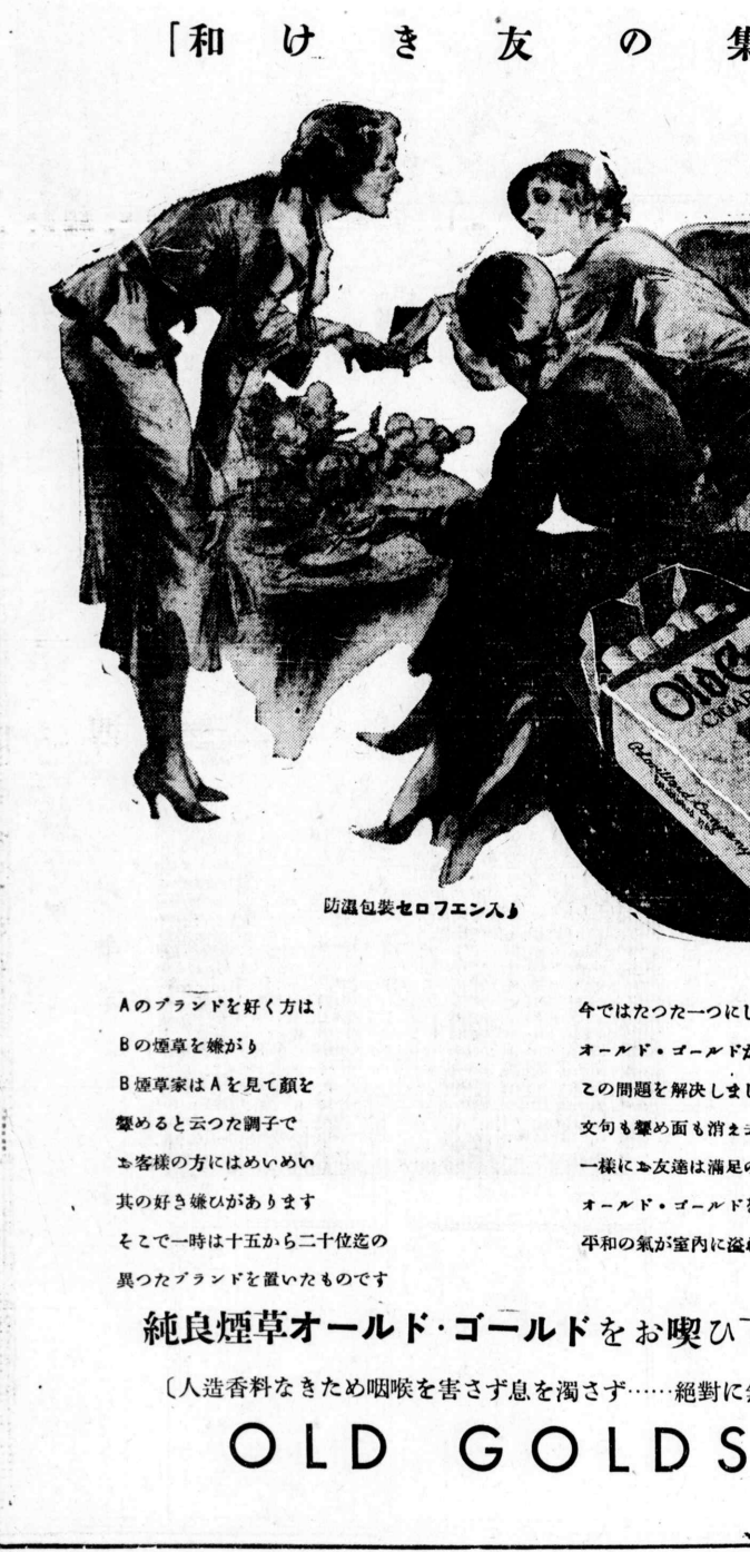
防濕包装セロフエン入