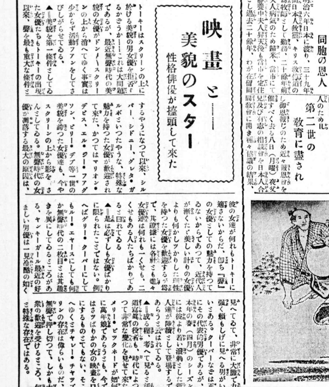
トキキはスクリーンの上にて、美しき女優の扮装を披露する。この女優は、最近の女優界の寵児である。トキキの活躍は、女優界の一大変革をもたらした。トキキの活躍は、女優界の一大変革をもたらした。トキキの活躍は、女優界の一大変革をもたらした。