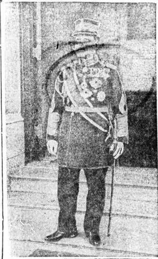
下殿王親仁載宮院閑 らせらあ任就御に長評説然に新

The Japanese American News PUBLISHED DAILY AT 550 ELLIS STREET SAN FRANCISCO 5, CALIFORNIA