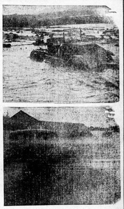
桑港附近の洪水 過日の大雨は、所々に洪水を起した。上は桑港附近自動車水