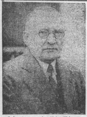
氏ダーパレンヤシたつ歸らか部支日過

（東京六日電）蔣介石氏は、張學良氏に對して、馬占山軍の件で叱責した。蔣氏は、張氏は、馬占山軍の件で叱責した。