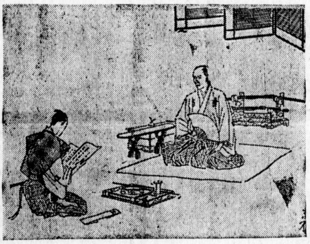
天保政談 近松秋江作