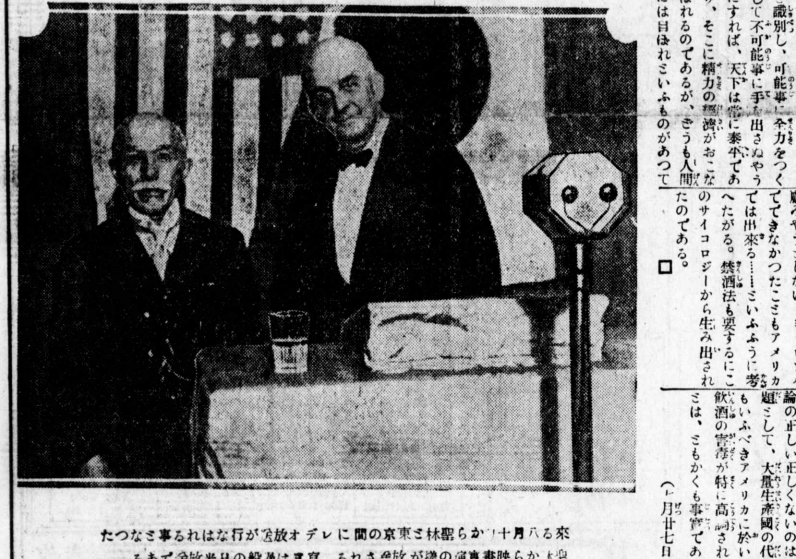
たつなき事なればは行が放放オテに開の京東東林都から十月八の来