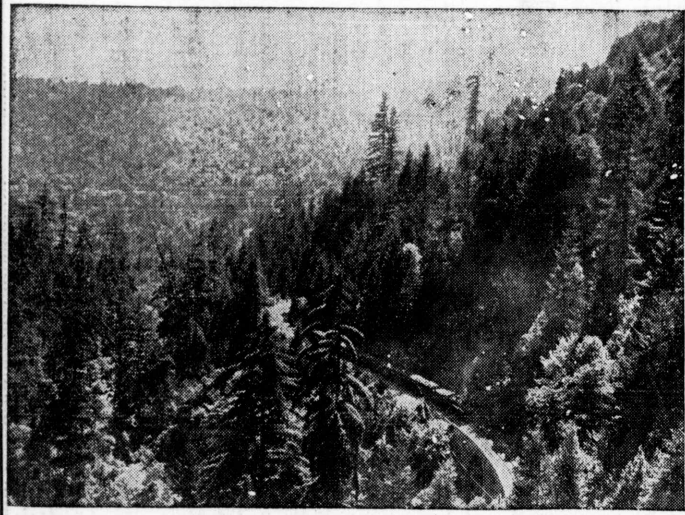
夏 六 題 林間スツチ (其の六)

佛女青大會の講習と見學が行われた。佛女青大會は、加州に在る。佛女青大會は、講習と見學が行われた。佛女青大會は、講習と見學が行われた。佛女青大會は、講習と見學が行われた。